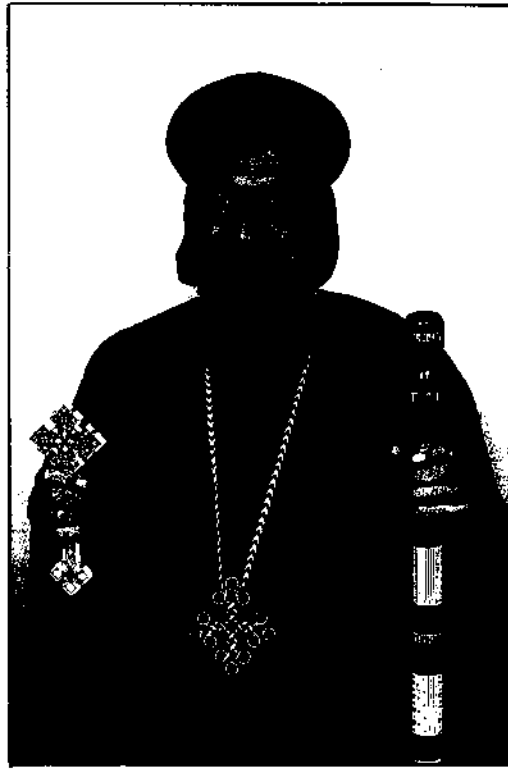
نيافة الأنبا صموئيل أسقف شبين القناطر وتوابعها